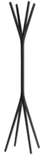
to'taime / 030