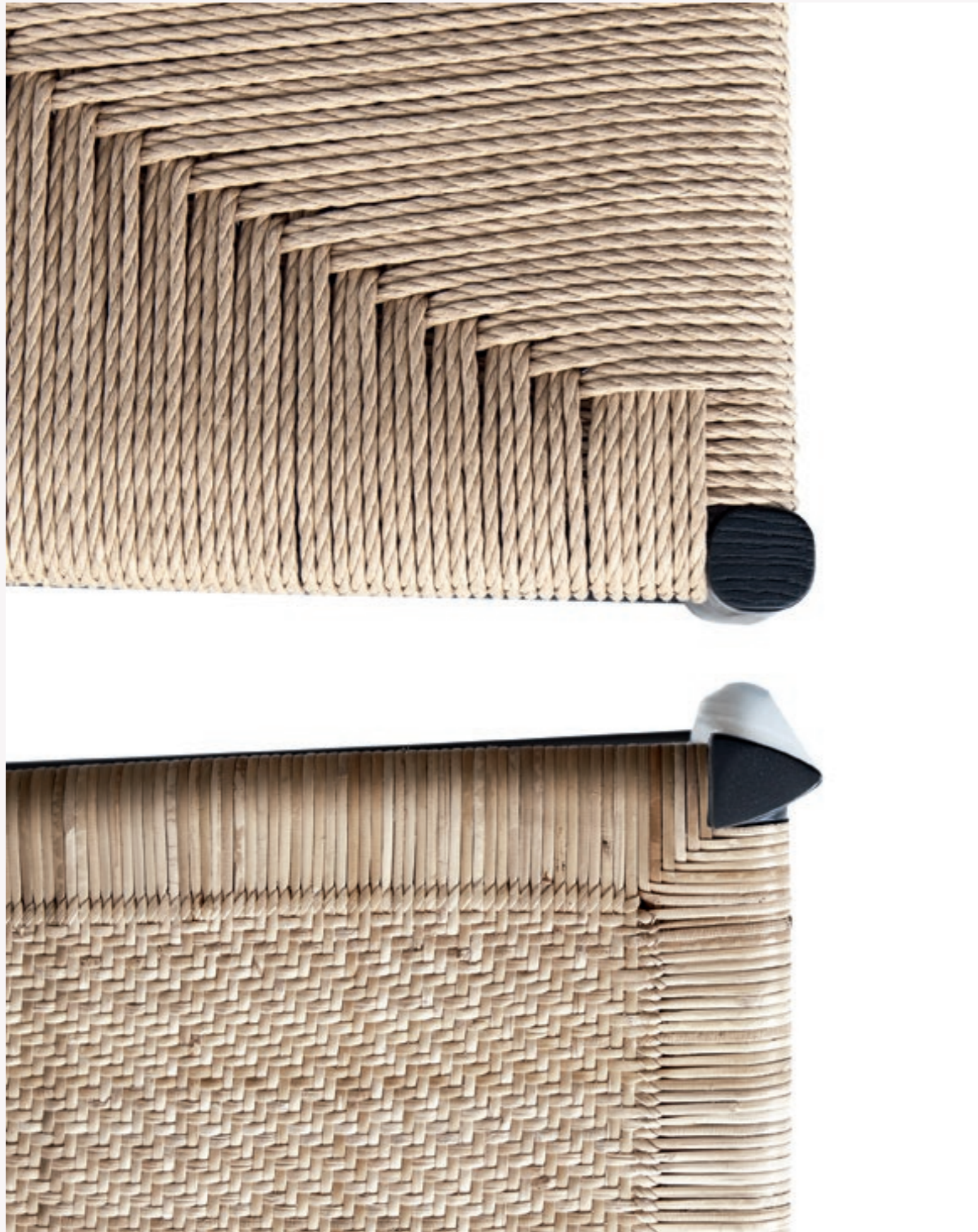
Sezioni delle gambe: quasi circolari, sedia Leggera – triangolari, sedia Superleggera/Legs sections: nearly circular, Leggera chair – triangular, Superleggera chair