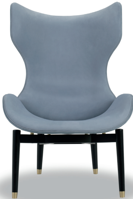
Kashmir Azure | Tuscany Punta Ala