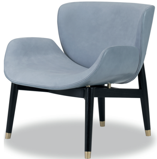
Kashmir Azure | Tuscany Punta Ala

Struttura schienale in legno multistrato di betulla. Imbottitura in poliuretano espanso a densità differenziata con rivestimento in fibra acrilica. Basamento in frassino tinto wengé. Puntale del piedino in ottone satinato, in metallo brunito spazzolato a mano o in metallo nichelato satinato, con vernice opaca.