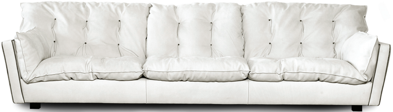
307 x 105 | Extra Opal | p. Bo.Hemian Siberia