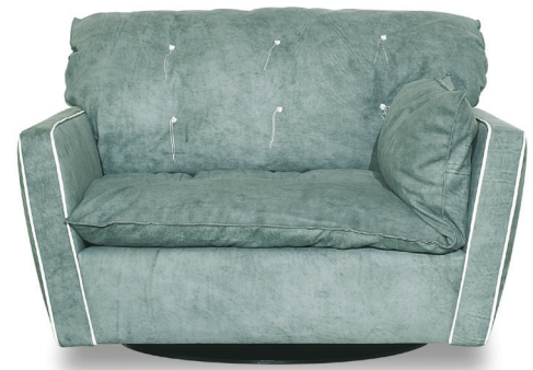
Bo.Hemian Nympha | p. Extra Opal

Struttura in multistrato fenolico ed essenza di abete. Imbottitura in poliuretano espanso a densità differenziata con rivestimento in fibra acrilica.