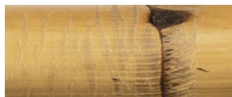
giunco di Manila Manila cane